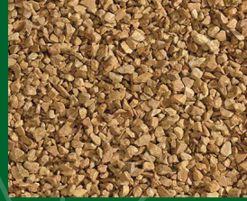
Giallo Mori 1.8-3; 3-5 [mm] in 25 kg Säcken