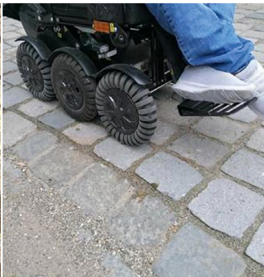
Rot an der Rot, Deutschland