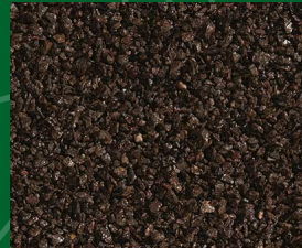
Porfido Marrone 1.8-3; 3-5 [mm] in 25 kg Säcken