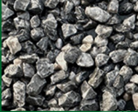
Grigio Trieste 3-5 [mm] in 25 kg Säcken

Die Flexystone®-PU-Harz-Verfugung passt sich ganz Ihren Ansprüchen und Wünschen an. Das betrifft nicht nur die natürliche Farbpalette aller Gesteinsarten, sondern auch die unzähligen Möglichkeiten bei der Verlegung.