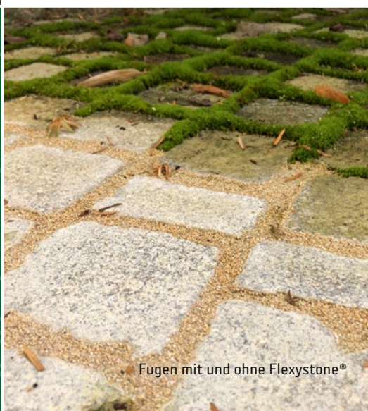
Fugen mit und ohne Flexystone®