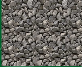
Grigio Cenere 1.8-3; 3-5 [mm] in 25 kg Säcken