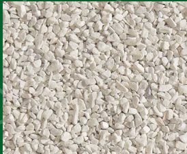
Bianco Zandobbio 1.8-3; 3-5 [mm] in 25 kg Säcken